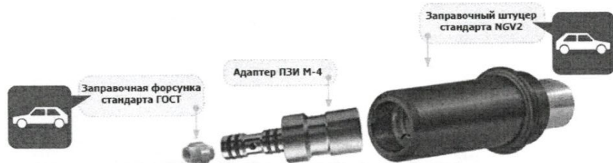
Рисунок 1 – Принцип использования переходника